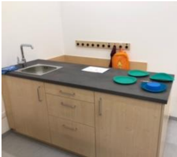
Pikler-Küche mit Podest für Kinder