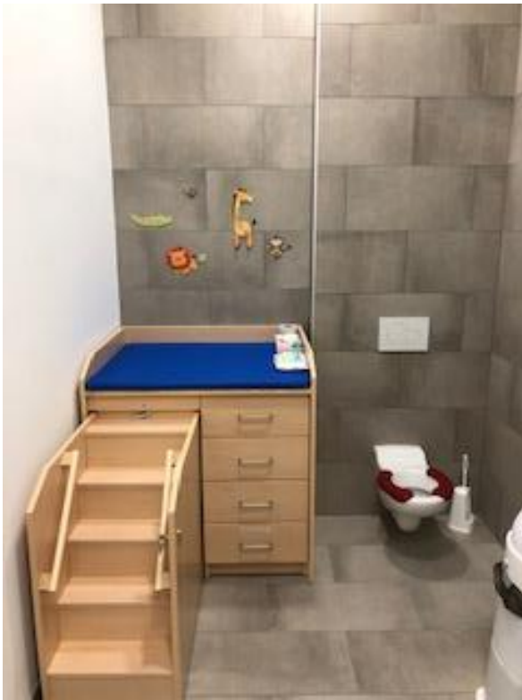
Wickeltisch mit Treppe