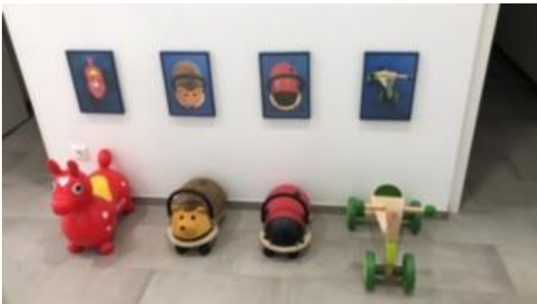
Kinderwagenabstellbereich und Parkplatz Fahrzeuge